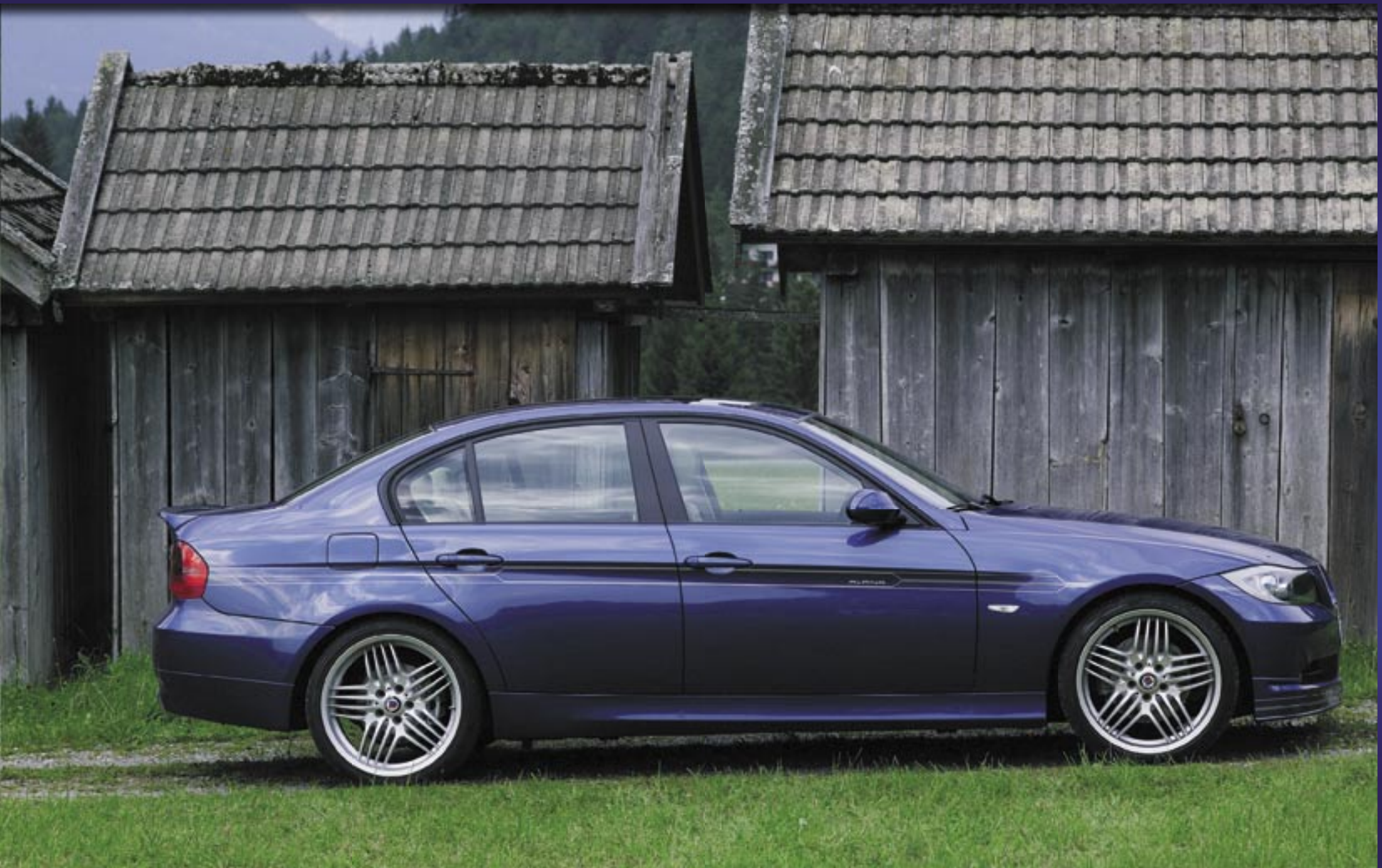
RAD ALPINA DYNAMIC 19" (SA) mit Reifen 235/35 R19 vorne und 265/30 R19 hinten