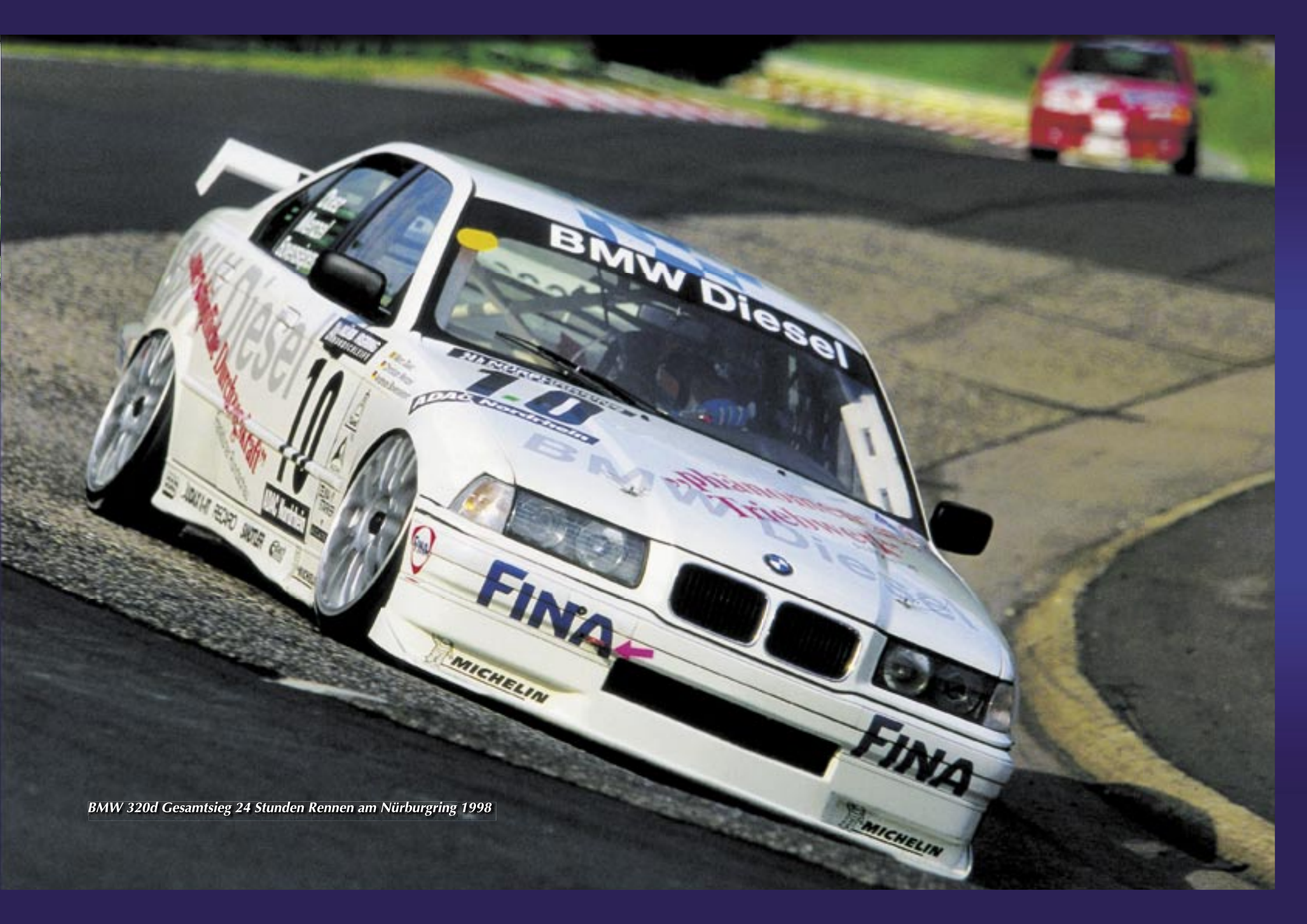
BMW 320d Gesamtsieg 24 Stunden Rennen am Nürburgring 1998