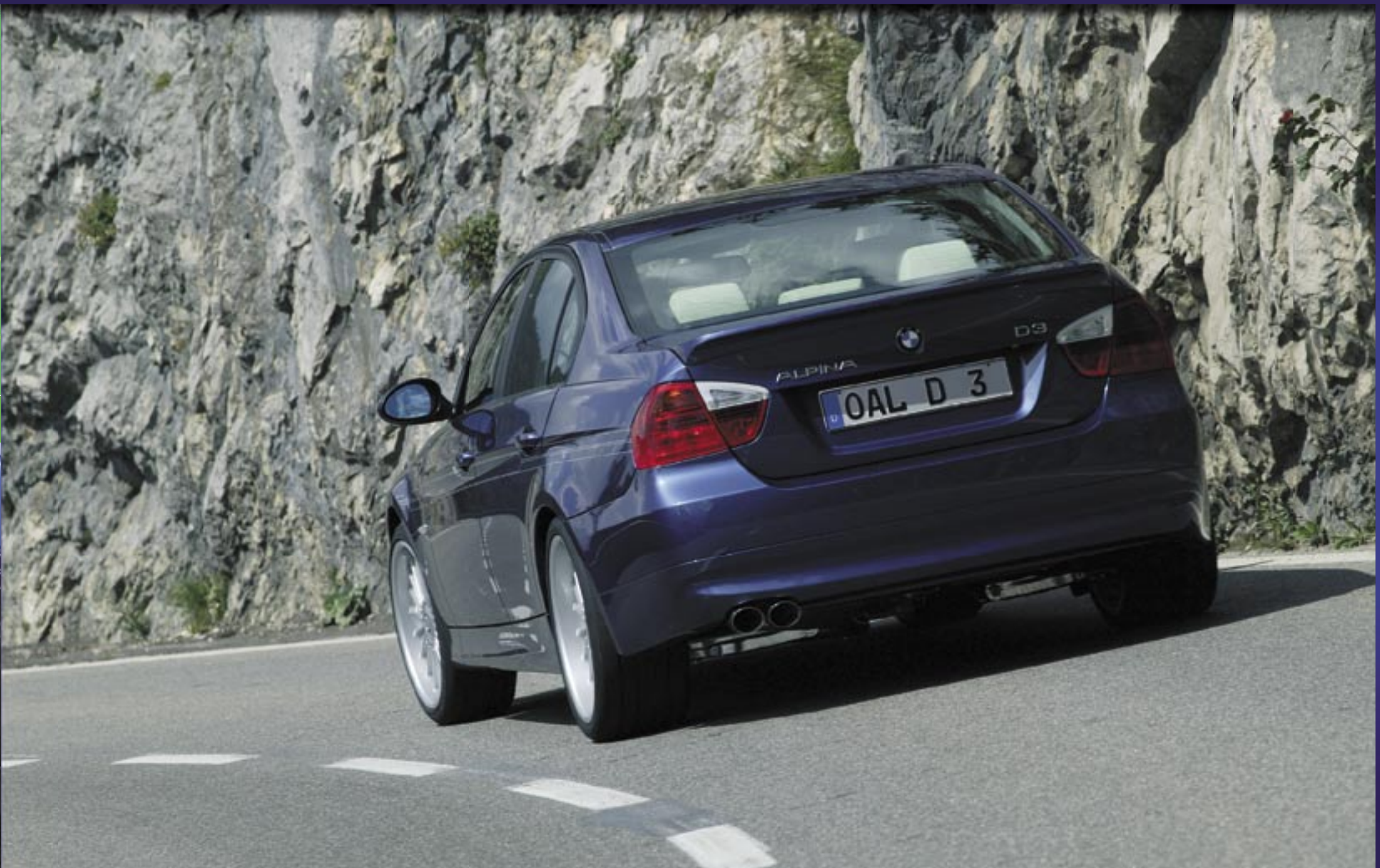
Ein Blickfang, harmonisch integrierter Heckspoiler (SA) und Doppelendrohr poliert